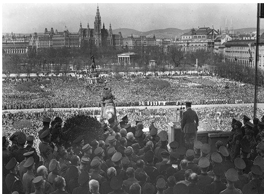
Гитлер выступает в Вене, 15 марта 1938 г.

Сюжет Всемирная история с Андреем Сидорчиком