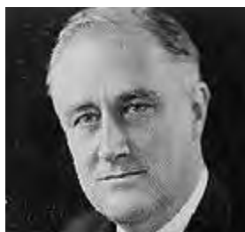
Франклин Д. Рузвельт

На выборах 1932 г. республиканский президент Г. Гувер, так и не предпринявший эффективных мер для преодоления кризиса, уступил демократу Франклину Делано Рузвельту .