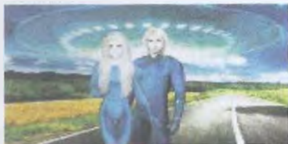
Рис. 8. Плеядцы