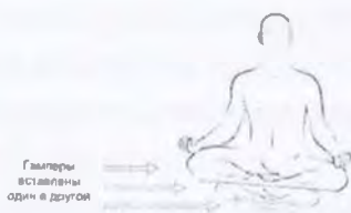
Рис. 3. Кулон

ставляет собой гампер без нижней части, вставленный в другой гампер (рис.3). Способствовал нарастанию у человека потенциала, что вело к открытию новых форм видения.