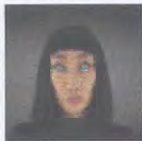
Рис. 7. Монголоиды