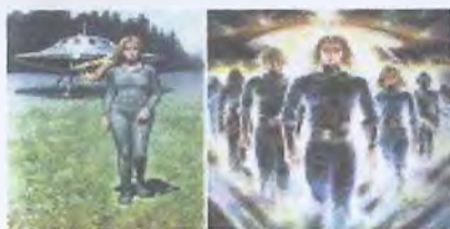
Рис. 9. Высокие нордики