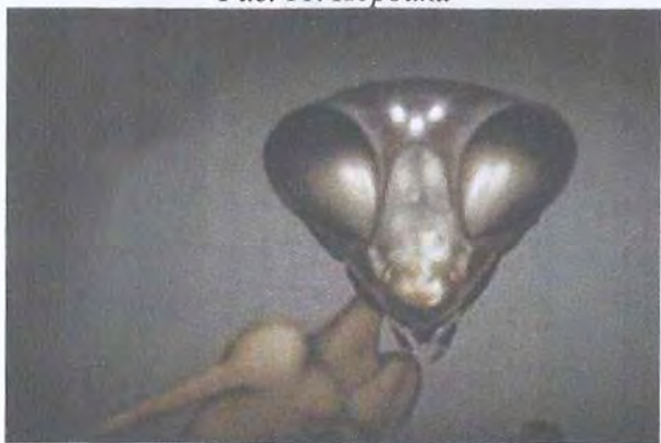
Рис. 12. Богомол