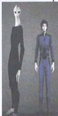
Рис. 10. Высокие серые