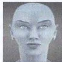
Рис. 5. С голубой кожей