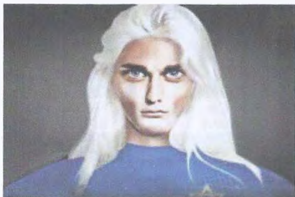
Рис. 11. Нордики