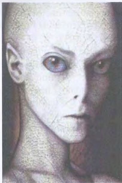
Рис. 15. Женщина рептилия