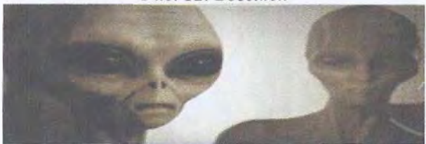
Рис. 13. Серые