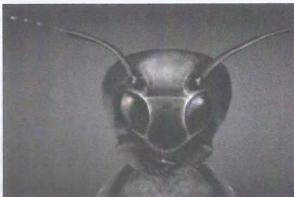
Рис. 14. Муравьиноподобные