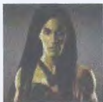
Рис. 6. С зеленой кожей