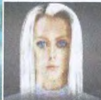
Рис. 4. Нордики, живущие в центре Земли