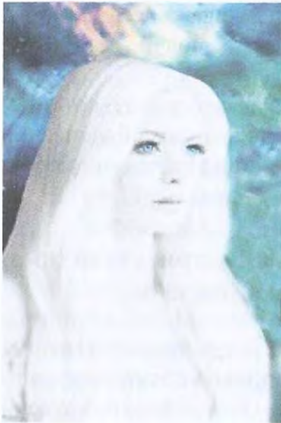
Рис. 3. Андромедянка