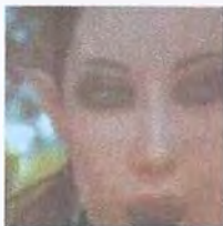
Рис. 4 Серые, управляются белыми инопланетянами с острыми ушами, представленными на данном рисунке