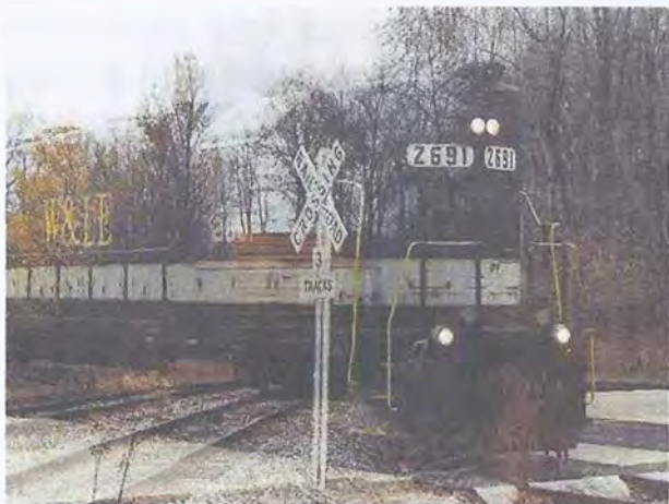
Фото 1. Пересечение пейзажей двух миров

свои произведения, можно было почитать эти произведения. А сейчас ничего нет. Ни видов гипноза, ни скрытых способов гипнотизирования - ничего неизвестно. В XIX веке можно было в какой-то степени ознакомиться с ними. Была школа Шарко, Ледбитера, исследования Дюрвилля, дэ Роша, ... - хотя последние, это не школы, а научные исследования, но они раскрывают суть того, почему нами можно управлять и как управлять.