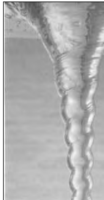
Вихрь возвращает воде ее естественное высокое внутреннее упорядочение молекулярных цепей.

Гомеопатия - логическое следствие этого. Она работает исключительно с энергетической информацией, которая накладывается на воду встряхиванием. Образующиеся таким образом скопления (cluster) создают со своей стороны, согласно резонансному закону, образец колебаний, который эффективен вплоть до духовных сфер. Чем «духовнее» (высокочастотнее) колебание, тем сильнее импульс лечения, т.к. любое излечение приходит от духа. По этой причине высшие потенции гомеопатии эффективнее низших. И кто продолжает искать здесь материально действующие факторы, тот значит решительно ничего не понял.